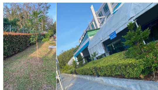
พื้นที่สีเขียว