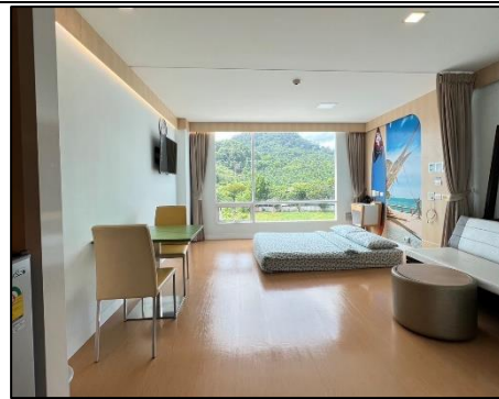
ห้องพักผู้ป่วย (สำหรับเด็ก)