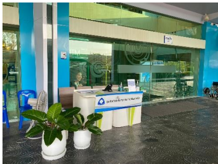
จุดคัดกรอง