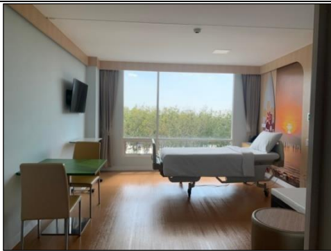
ห้องพักผู้ป่วย