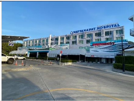
อาคารหลัก