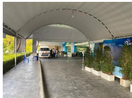
จุดจอดรถรับส่งผู้ป่วย