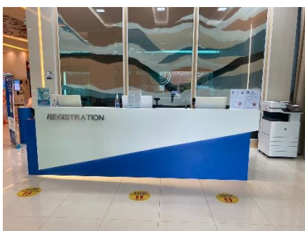
จุดลงทะเบียนผู้ใช้บริการ