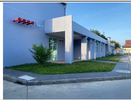
อาคารสนับสนุน